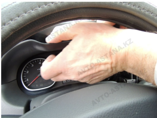
Фото 2.3 Панель управления