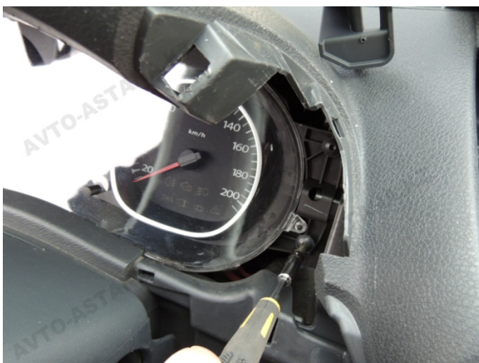
Фото 4. Откручиваем приборную панель