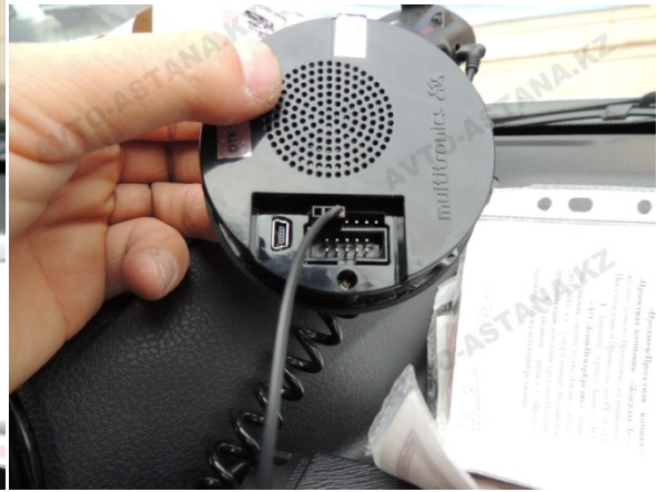
Фото 7. Подключаем основной шлейф