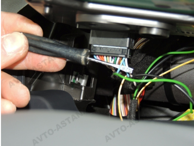
Фото 9. Подключаем зеленый провод к контакту №24

9. Зеленый провод основного лейфа подключаем к контакту № 24 (серый провод) черной колодки. Датчик температуры выводим в подкапотное пространство и собираем переднюю панель в обратной последовательности. (фото 9)