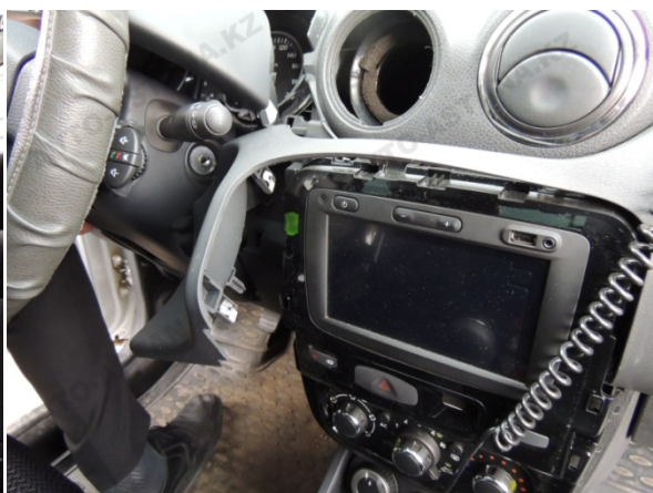
Фото 2.7 Панель управления