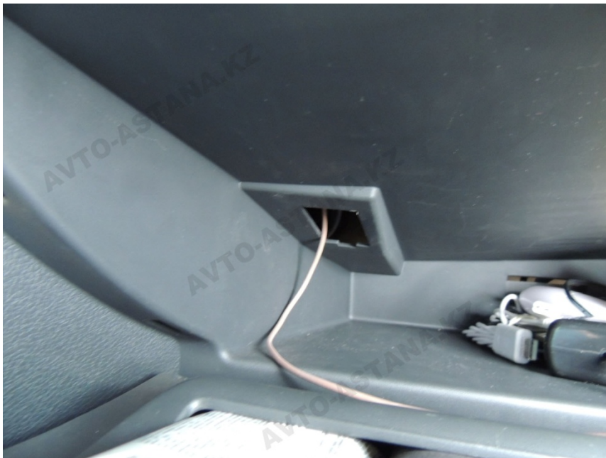
Фото 6. Протаскиваем шлейф бк