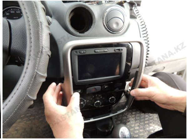
Фото 1.1 Панель управления

2. Последовательно вынимаем элементы передней панели для доступа к приборной панели. (фото 2-2.1.2.3.4.5.6.7.8.9)