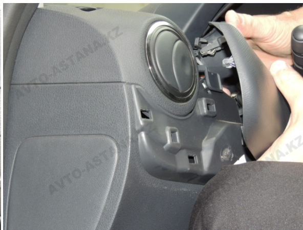
Фото 2.9 Панель управления