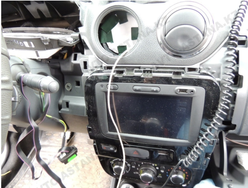
Фото 5. Откручиваем приборную панель