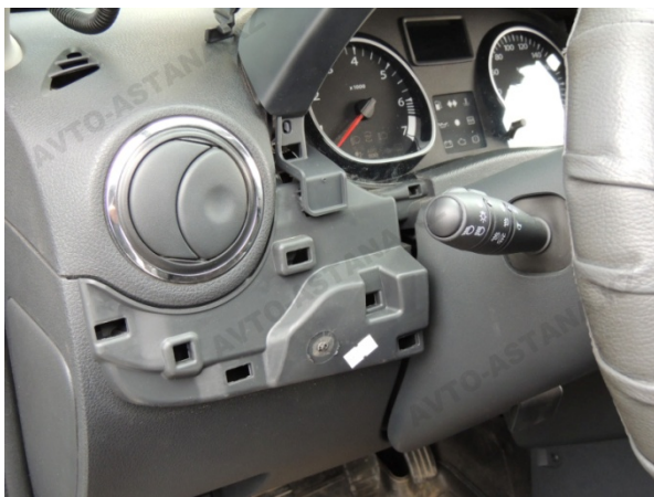
Фото 2.8 Панель управления