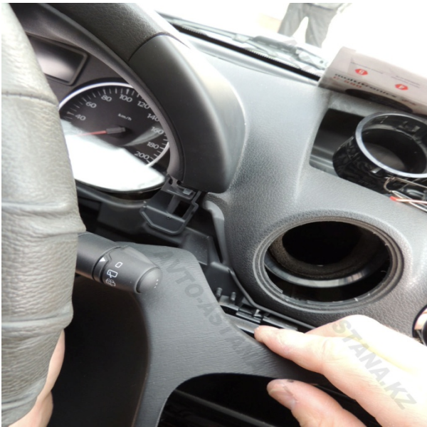
Фото 2.1 Панель управления

2. Последовательно вынимаем элементы передней панели для доступа к приборной панели. (фото 2-2.1.2.3.4.5.6.7.8.9)