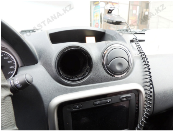
Фото 1. Панель управления

1. Начать установку бк можно со снятия верхнего дефлектора, аккуратно поддев ее в боковые прорези (Фото 1-1.1).