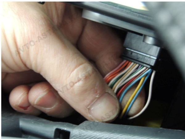
Фото 8. Подключаем желтый провод шлейфа к контакту №10