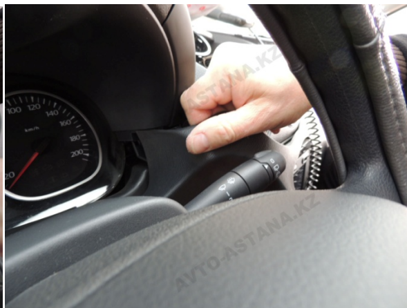
Фото 2.5 Панель управления