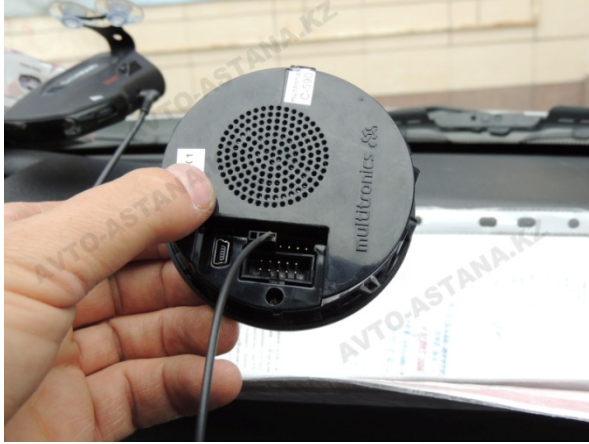
Фото 7. Подключаем дополнительную фишку с проводом