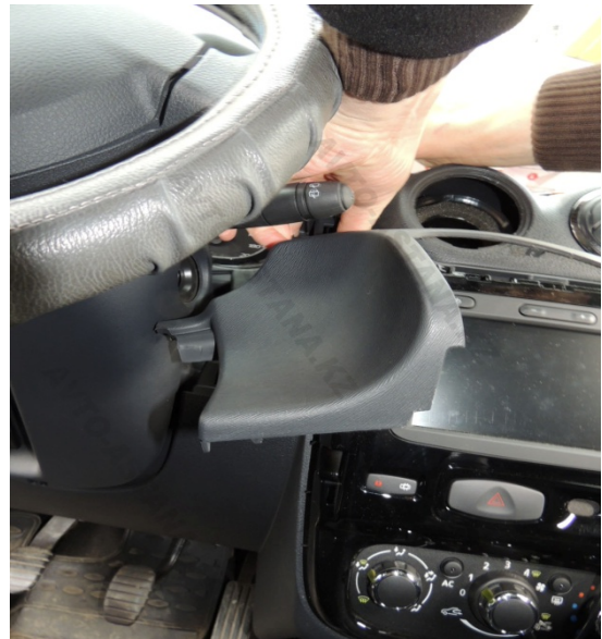
Фото 2.2 Панель управления