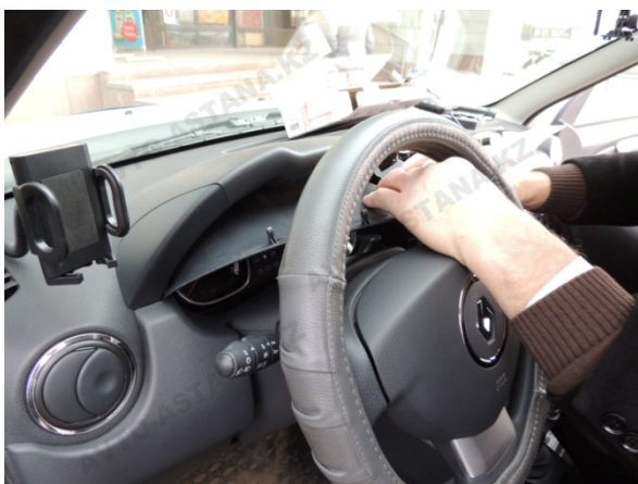
Фото 2.6 Панель управления