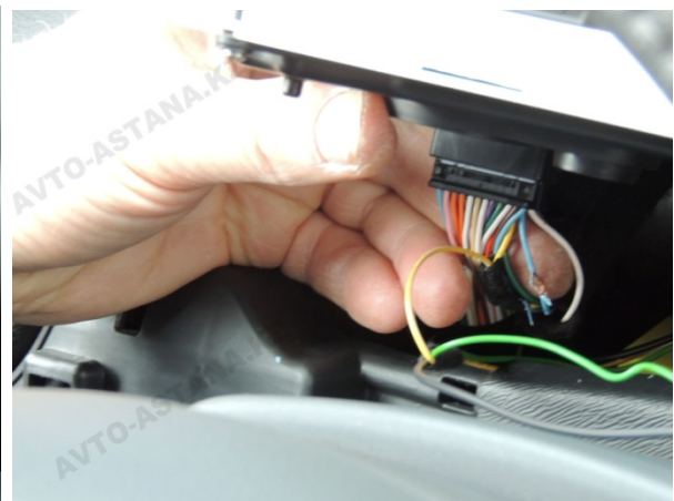
Фото 8.1 Подключаем голубой провод №11 к черной колодки.